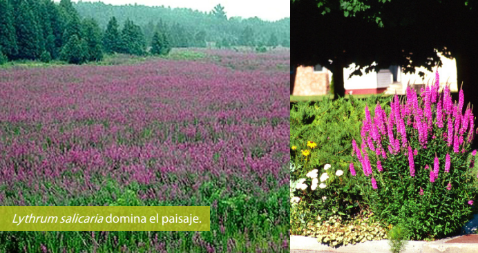
Lythrum salicaria domina el paisaje.

Esta especie produce semillas de manera prolífica. Llega a producir entre dos y tres millones de semillas al año.