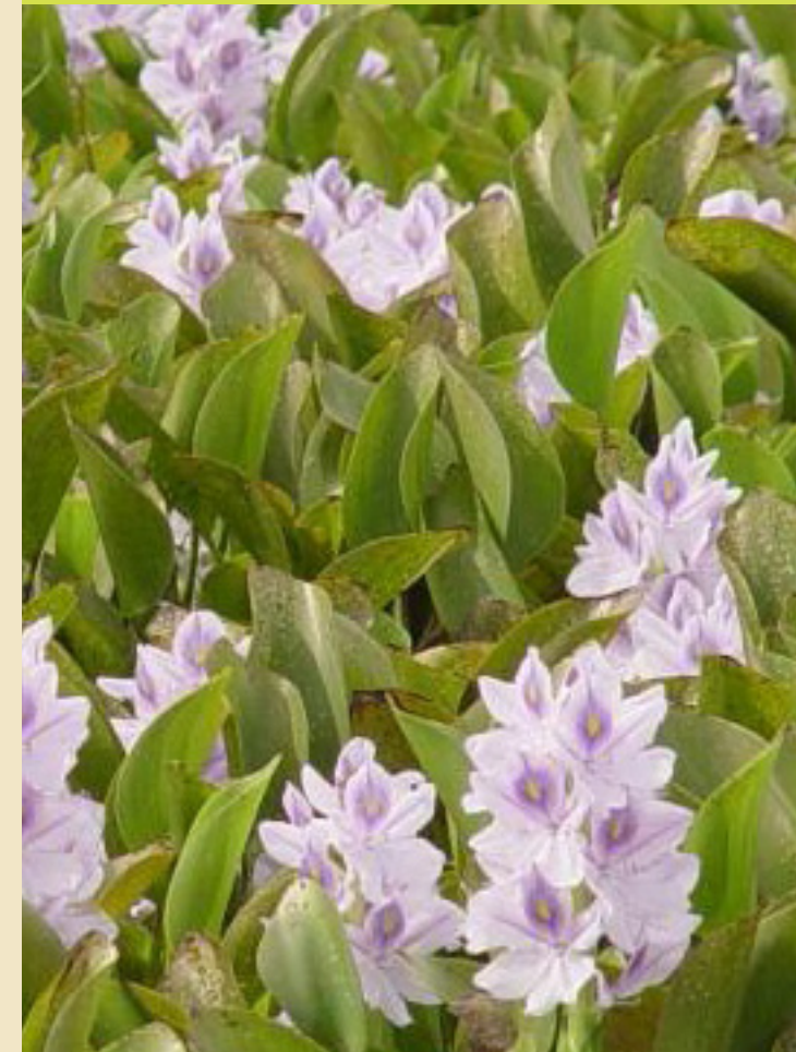
Las apariencias engañan – el lirio acuático Eichornia crassipes taponan canales y cubren cuerpos de agua.

Este programa proporciona información para aficionados a la jardinería y jardineros sobre el manejo de sus jardines para preservar las cualidades únicas de las áreas silvestres circundantes. El programa consta en una asociación entre la oficina nacional de parques de los EE.UU. National Park Service, el centro de flores silvestres Lady Bird Johnson Wildflower Center, el club de jardín de América Garden Club of America, y el consejo nacional para especies invasoras National Invasive Species Council entre otros colaboradores cuyo objetivo es reducir la cantidad de plantas invasoras en los jardines urbanos.