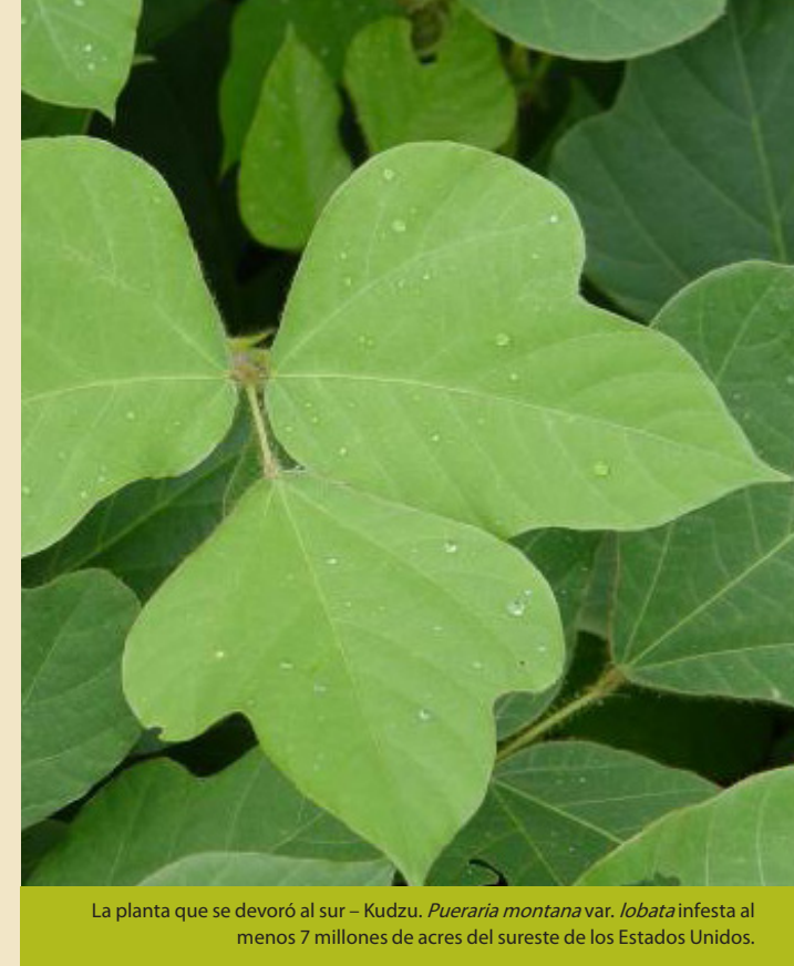
La planta que se devoró al sur – Kudzu. Pueraria montana var. lobata infesta al menos 7 millones de acres del sureste de los Estados Unidos.

9. Tenga cuidado al deshacerse de plantas invasoras. Al desechar el materia vegetal, fíjese si hay semillas, frutas o vástagos que se puedan reproducir. Queme el material vegetal siempre y cuando sea permitido y seguro o al menos embólselas para prevenir que se diseminen.